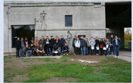
Nous, devant la façade de l'Unité d'habitation, à côté du Modulor.

Certains élèves installateurs thermiques ont ensuite réalisé un bilan thermique de l'appartement témoin. Le bilan est négatif en raison de l'énorme déperdition de chaleur. Il n'y a pas suffisamment d'isolation (voir les couleurs froides aux abords des fenêtres). Des futurs assistants architectes ont mesuré l'appartement témoin avec des lasers-mètres puis ont réalisé des croquis à main levée .