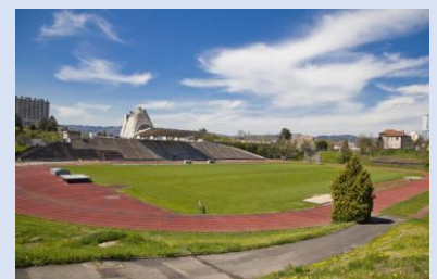
Le stade et l'église