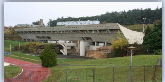
La Maison de la Culture