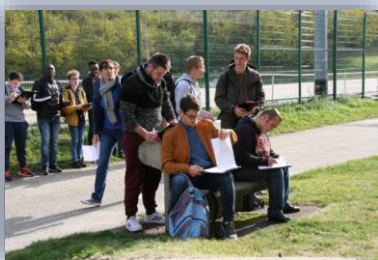
Réalisation de croquis de la façade de la Maison de la culture.