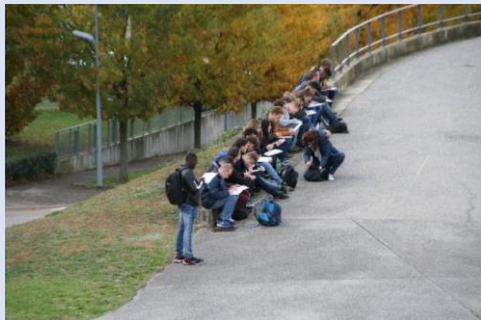
Réalisation des croquis de l'église Saint-Pierre

Après la visite, nous avons dessiné la façade de l'Unité d'habitation avec ses pilotis et loggias ainsi que celle de l'église Saint-Pierre.