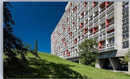
Façade de l'Unité d'habitation

Nous avons bien aimé découvrir ces constructions hors du commun réalisées uniquement en béton armé. Les bâtiments du Corbusier sont atypiques et il a su agencer des appartements spacieux pour l'époque. Nous avons approfondi nos connaissances sur cet architecte mondialement connu et avons complété notre travail de recherche sur l'œuvre de Le Corbusier dans le monde et en région Rhône-Alpes-Auvergne. Enfin, nous avons apprécié de voir que cet architecte avait à cœur de construire tout en assurant un équilibre entre l'épanouissement individuel et le collectif. Terminons par une de ses citations : « L'architecture, c'est une tournure d'esprit et non un métier ».