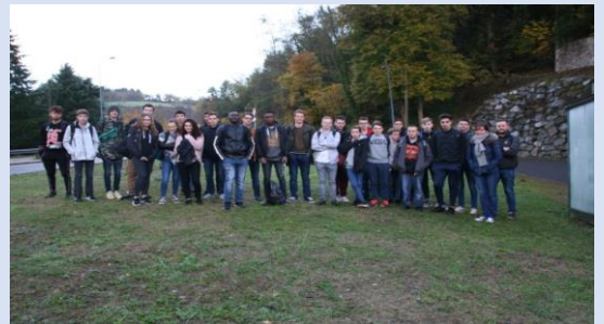
Départ de Néronde - élèves d'ITITA + T. IPTI et leurs enseignants

La matinée s'est terminée par la réalisation de croquis de la façade sud de la Maison de la culture , œuvre de Le Corbusier et du compositeur Iannis Xenakis avec ses pans de verre entremêlant couleurs et mesures musicales ainsi qu'architecturales.